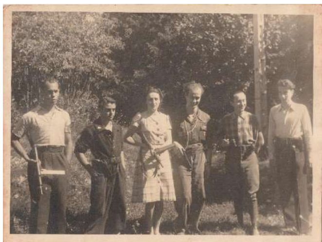
Médecins et maquisards à Mériçou, été 1944