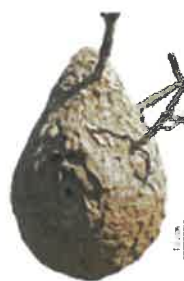
FRELON ASIATIQUE Vespa velutina